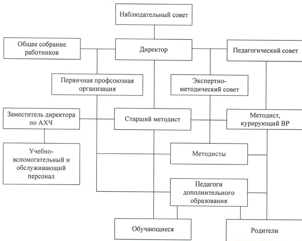
Рисунок 4. Система управления МАОУ ДОД СДЮТЭ

Управление приобретает все более выраженную функцию профессиональной, методической работы педагога. Педагоги являются активными участниками процессов планирования, реализации и подведения итогов деятельности Станции. Каждый педагог является организатором (куратором) проведения мероприятий институционального, муниципального, краевого, Всероссийского уровней, что способствует профессиональному росту педагогических кадров. Инициативы педагогов поощряются администрацией Станции.