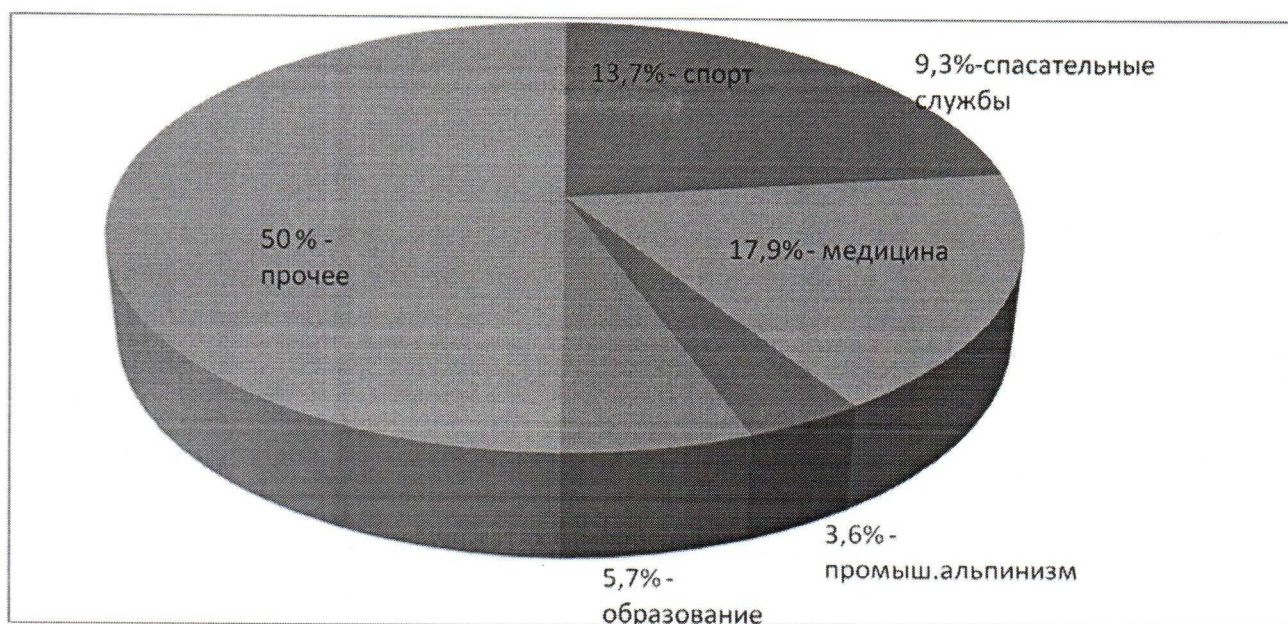
Рисунок 3. Сферы деятельности, востребованные выпускниками МАОУ ДОД СДЮТЭ

Представленные данные подтверждают тенденцию профессионального самоопределения выпускников Станции за предыдущие годы, которые в настоящее время работают участковыми оперуполномоченными, пожарными, спасателями МЧС, педагогами дополнительного образования по спортивному туризму, учителями физкультуры, хирургами, сотрудниками Скорой помощи, врачами, специалистами в промышленном альпинизме и др.